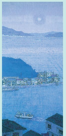
「渡し船(首戸の瀬戸)」 1987年 油彩・キャンバス