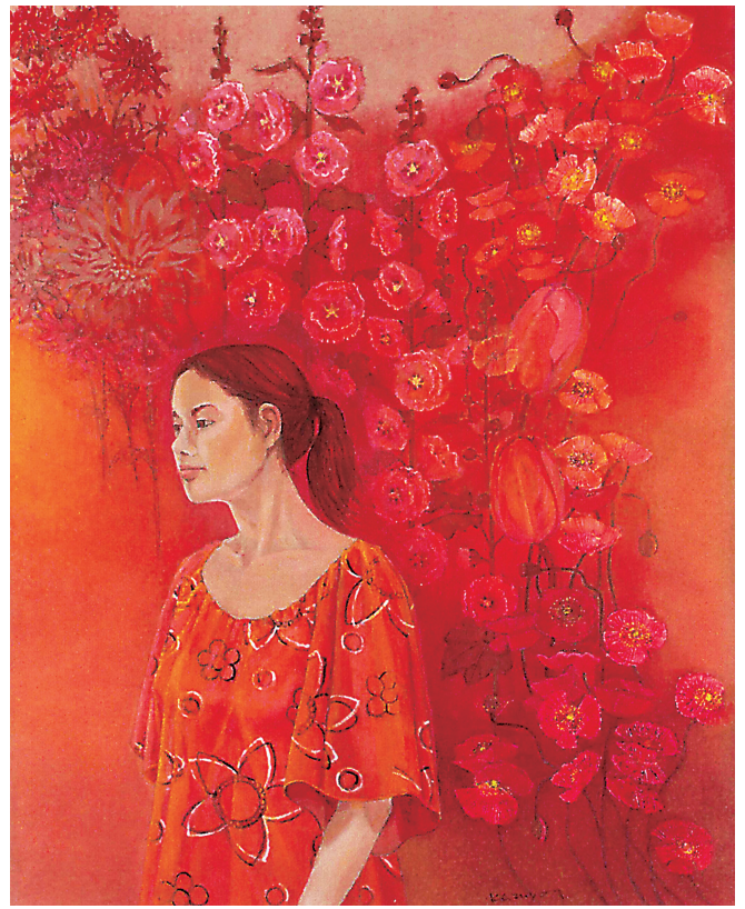
岩池和代 「花の断章」 2016年 油彩・キャンバス